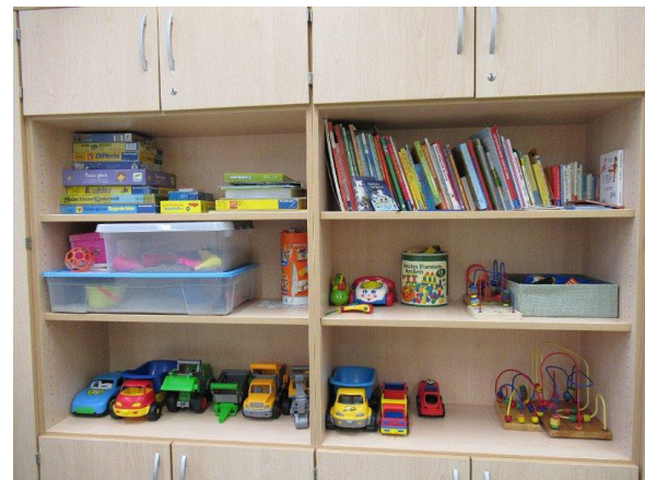
Das Spielzimmer im Mehrgenerationenhaus